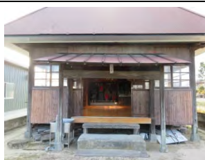
73 地藏堂 佐賀市久保田町久保田下新ヶ江 73

有明沿岸道路の芦刈 IC 出て、国道 444 号線を福富方面へ約 1 km 進むと、整骨院裏の公園脇にある。お堂は近年立て替えられ、大師堂には生花が飾られ、管理が行き届いている。資料には所在地特定不祥となっていたが、芦刈在住の郷土史家の岡本澄雄先生より、教えてもらい 40 番札所板も確認できた。