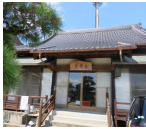
59 江頭山 長寿庵 臨済宗南禅寺派 佐賀市鍋島八戸溝 1653

国道 34 号線「森田」交差点を南へ 500m。JR 高架橋脇にある。案内板に龍造寺康家公の六男、上水上山万寿寺の 9 世刺賜天享宗儀大和尚禅師が開山。山門過ぎると南北に 1.5~2.1m の六地藏塔立っている。境内には観音像や石碑が多くある。