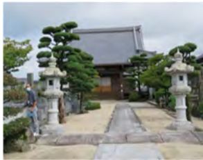
80 瑠璃光山 好昌院 臨済宗南禅寺派 佐賀市大和町東山田 3944

県道 48 号線「川上小北」を北へ高速をくぐり 800m 大願寺部落を通り山に向かうと佐賀平野が一望できる高台にある。境内に戦前国宝指定の銅鐘がある（現在重要文化財）大友軍による戦火消失、大洪水被害の歴史が有る。