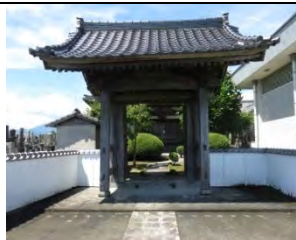
74 聴松山 平安寺 臨済宗東福寺派 小城市牛津町 156

国道 207 号線「久保田宿」から西へ 400m 行くと見える。本堂は公民館造りの新しい建物。本堂右側に 76 番札所掲示。久保田町史には開山大興和尚。寺院明細帳に文明 15 年(1483)小城円通寺の末寺として第四世覚海和尚が設立に寄与したとある。明治初期勝前寺を合併した。