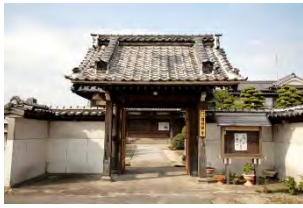
29 光明山 圓照寺 臨濟宗南禅寺派 佐賀市川副町鹿江523

西川副小学校南西約800 m、1470年頃の創建。本尊 は延命地藏大菩薩、龍造寺隆信 の佐賀城奪還の際の旗揚げとな った寺。隆信画像や出陣時の太 鼓などが寺宝として保管されて いる。