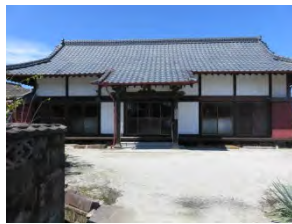
61 東光山 勝福寺 曹洞宗 佐賀市鍋島町森田 3416

国道 34 号線「森田」交差点を北へ「森田北」から西へ 200m に木々に囲まれて、住宅地の一角にある。門柱の文字は読めない。境内に 20 体以上の赤いエプロンを付けた地藏がある。本堂内には鍋島家の家紋あり。鍋島家の祈禱寺。戦時に寺の竹を旗竿に、武運を祈願した