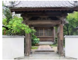
8 定慧山 智徳寺 臨済宗東福寺派 佐賀市大和町尼寺 3416

県道 48 号線大和中学校前より南へ 300m にある。創建は不明だが江戸初期との事。寺域・本堂の規模は大きく、整然とした趣で門前には広大な水田が広がっている。嘉瀬川の氾濫で過去 2 回の被害あり。六地藏塔は門柱横にある。地域住民との座禅会、写経会も開催されている。