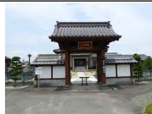
47 松林山 西光寺 浄土宗 佐賀市本庄町末次909

本庄小学校南1km、1553年の龍造寺隆信の佐賀城奪還に寄与。1596年頃に慶間寺三世文応全藝が開山し、曹洞宗慶間寺の末寺とした。享保年間造立の地藏が祀られている。