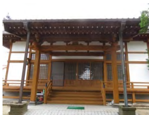
10 補陀落山 長谷寺 臨済宗東福寺派 佐賀市大和町尼寺 1462

国道 263 号線バイパスを川上方面へ、大和イオン前にある。寺の創建は鎌倉後期と思われ、東福寺の末寺である。山門入って左側に愛宕堂と呼ばれる祠があり、中には愛宕様と呼ばれる勝軍地藏が祀られ、合格必勝祈願者も多いと言う。