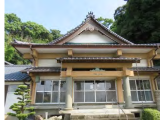
84 真手山 健福寺 真言宗御室派 佐賀市大和町川上 3881

国道 263 号川上狭官人橋を渡り、212号線を南へゴルフ場案内口を入り 800m 道なりに、ゴルフ場入口をみて、右側へ山道を 500m で着く階段上ると正面は本堂。鍋島家の祈願寺として格式ある寺で、末寺 83 の地域の本寺であった。 通称お不動さん