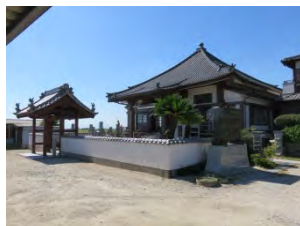
66 東陽山 松林寺 曹洞宗 佐賀市嘉瀬町中原 636

国道 207 号線「嘉瀬元町」交差点から南へ 1 km にあり、寺歴は 400 年を超えている。山門入ると右手に 63 番札所の大師堂がある。ここ中原地区は豪族蒲原一族の所領地で、当時の開基も一族が行っている。寺号から昔は有明海に臨む地、海岸近くで栄えた土地柄。境内には多くの地藏がある。