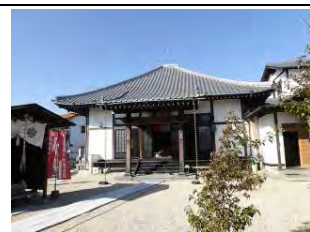
53 大宝山 円光院 曹洞宗 佐賀市西与賀町今津乙75

西与賀小学校北東約600m、本堂左側一室には八十八か所巡りの札所や遍路を描いた畳一枚くらいの絵図が掲げられており、御朱印も保管されていた。近くに「今津湊渡し場跡」の石碑。