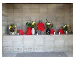
40 地藏堂 小城市芦刈町永田 308 裏

国道 207 号線徳万交差点を南へ、県道 44 号を進み思斉館小中学校入口を西へ 1600m。門柱~山門~本堂入口は他の寺と異なり、カラフルな塗装で本堂も実用的な建築となっている。山門前には六地藏塔、三界万霊塔、千手観音像、子安観音像、石像、石碑多数