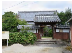
63 猷珠山 海孺寺 曹洞宗 佐賀市嘉瀬町中原 1604

国道 208 号線「新栄小学校前」交差点ホテルマリトピアを見て西へ右折 700m。川を渡ると見える。寛永 2 年（1625）現在地より北 JR 鍋島駅近く傳國宗的禅師が開山。昭和 48 年現在地に移転。山門入ると左手に観音菩薩、右手に大師堂がある。参道両脇に墓所、石像、石碑が並んでいる。