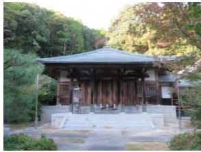
86 水上山 万寿寺 臨済宗南禅寺派 佐賀市大和町川上 1109

国道 263 号川上狭官人橋を渡り、212号線を南へゴルフ場案内口を入り 800m 道なりに、ゴルフ場入口をみて、右側へ山道を 500m で着く階段上ると正面は本堂。鍋島家の祈願寺として格式ある寺で、末寺 83 の地域の本寺であった。 通称お不動さん