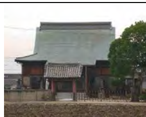
26 海雲山 泊舟院 曹洞宗 佐賀市西与賀町高太郎467-1

西与賀小学校北西約400m、本尊は千手観世音菩薩。1617年の創建、龍泰寺の末寺。境内には延命地藏尊を祀る地藏堂があり、祈願絵馬が30枚ほど奉納。本庄江から有明海に出る船着き場。