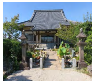
64 臨江山 瑞光寺 臨済宗南禅寺派 佐賀市嘉瀬町中原 2102

国道 34 号線「森田」交差点を南へ流通センター交差点を西へ 1 km 進む。1515 年菅原道真の従弟の流れで、前山美濃守菅原利郷が創建。250 年前に描かれた大涅槃図があり、今でも色鮮やかな輝きを放つ。大般若經典が大村市で、戦国時代に作成された貴重な資料と判明。展示会も大村市で開催された。