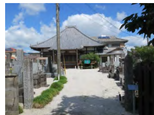
6 金峰山 石水寺 曹洞宗 佐賀市八戸溝 2-4-24

国道 207 号線「八戸」交差点より西へ 50m で左側にある。山門通ると本堂左に 3 番札所の大師堂がある。番号は石柱に刻印。寛文年間 17 世紀末代に天祐寺（佐賀市多布施）の第 20 世が隠居寺として開基。鍋島家の祈願寺として栄えた。現在は龍雲寺（佐賀市八戸）住職が兼務している。