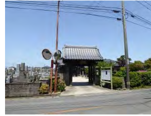
27 金剛山 安龍寺 真言宗御室派 佐賀市諸富町為重1586

佐賀市川副支所北側約1km、 龍造寺隆信の遠縁の当地の豪族 鹿江遠江守兼明が1530年 に、水ヶ江龍造寺家兼の弟天享 和尚を請して開山。その後、1 2か寺の末寺が建てられたと言 われる。