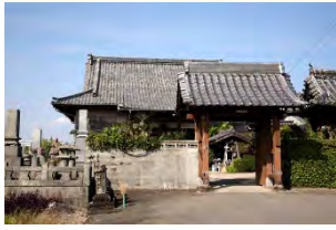
31 明宝山 東泉寺 臨濟宗東福寺派 佐賀市川副町西古賀76

早津江病院南西約600m、 創建年代は不詳、固山一鞏和尚 による開山とされる。中興の梅 叔の代に鍋島家の命により薬師 如来を奉じて再建。寺宝として 大般若経600巻が伝わる。