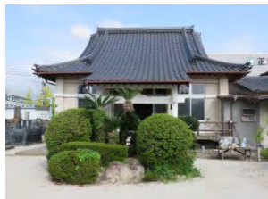
58 祥雲山 廣福寺 曹洞宗 佐賀市鍋島町八戸 3032

国道 263 号線バイパス「大和工業団地」交差点を西へ「蛸川橋」を超え酒店前より南へ 400m 行く。本堂右側に七番札所の大師堂がある。開山は鮮溪和尚・天文 23 年（1552）蛸久天満宮社家、右近刑部氏で菅原道真の後裔・当院の東側「尚賢保育園」は昭和 28 年任職が自主的に創立した。