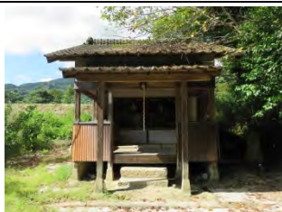
83 仏乗寺 (真言宗) 佐賀市大和町久留間今山

国道 263 号線「尼寺上町」より東へ国分寺北を過ぎ 80m にある。現在は廃寺で奈良時代、国毎置かれた官位の寺であった。南北朝時代から室町時代に衰退したと、寛政 4 年の絵図には当時の様子が描かれていた。道を挟んで反対側に大きな石碑が当時の遺跡かも。近くに国分尼寺跡もある。