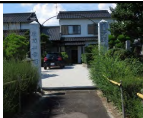
77 楽音山 明春寺 臨済宗南禅寺派 佐賀市久保田町久保田 150-2-1

国道 207 号線「久保田宿」から西に 300m で小道を北に入る。広い駐車場と案内板の先に山門、本堂右軒下に文政二年十月十八日刻印の古い梵鐘、当初楽音寺で天台宗より転派、戦国時代に千葉明春氏の菩提を弔う為明春寺と改称した。