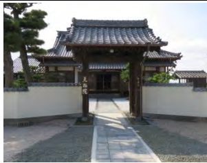
5 祝融山 天福院 曹洞宗 佐賀市新栄西 1—6—8

207 号線「高橋」交差点過ぎ西へ 300m で北側にある。元々鍋島町にあったが元禄年間（1866~1703）嘉瀬町に移転した。山門を入ると右側に新しい 2 番札所の大師堂。さらに「佐賀錦発生の地」段通碑があり、江戸時代「扇町紋せん」を酒井清右衛門が始めた歴史記述がある