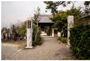
28 不二山 多聞院 真言宗御室派 佐賀市諸富町為重873

諸富南小学校南寺井津パイパ ス南約300m、創建は8世紀 中頃の天平年間とされ、開基は 行基菩薩。1584年、龍造寺 隆信が軍を休めたとの記録もあ る。本堂に鍋島勝茂の病氣平癒 の絵馬が奉納。