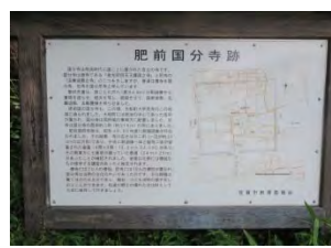
11 国分寺跡 仏教礼拝所 佐賀市大和町尼寺 968

国道 263 号線「尼寺北」を東へ 150m にある。門柱を過ぎると左側に、真新しい大師堂がある。 境内には佐賀藩神代家の家臣で脱藩して討幕の計画をした罪で死罪となった国学漢学者・横尾紫洋の墓がある。また、墓は永明寺（芦刈町）の両方にある。