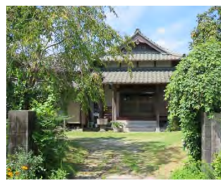
60 松林山 勝楽寺 真言宗御室派 佐賀市鍋島町森田

国道 34 号線「森田」交差点を南へ 500m。JR 高架橋脇にある。案内板に龍造寺康家公の六男、上水上山万寿寺の 9 世刺賜天享宗儀大和尚禅師が開山。山門過ぎると南北に 1.5~2.1m の六地藏塔立っている。境内には観音像や石碑が多くある。