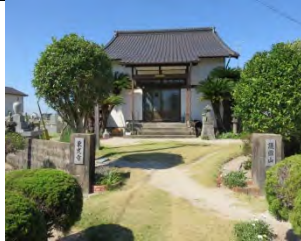
67 護国山 東光寺 曹洞宗 佐賀市嘉瀬町中原 1621

国道 207 号線「嘉瀬元町」より北へ 200m で田圃に囲まれた所にある。創建は 250 年まえに近郷 2 寺と合併統合されている。現在大師像は本堂の本尊像の隣に祀ってある。嘉瀬町史によると平成 15 年に嘉瀬地区での遍路行事は終わりとなった。寺の周囲は田圃風景が広がっている。