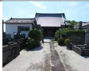
75 大雄山 報恩寺 臨済宗東福寺派 小城市芦刈町浜枝川浜中 377

国道 207 号線から牛津天満町交差点を南へ 400m 行くと西にある。長い参道から山門を入ると、一對の六地藏塔、本堂前左側に札所 74 番を掲げた 4 体の地藏を祀ったお堂がある。約 400 年前創建。二度の火災にあい昭和 12~14 年再建。