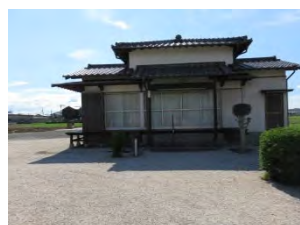
76 恵日山 永福寺 臨済宗南禅寺派 佐賀市久保田町久保田 26

国道 207 号線「久保田宿」から西に 300m で小道を北に入る。広い駐車場と案内板の先に山門、本堂右軒下に文政二年十月十八日刻印の古い梵鐘、当初楽音寺で天台宗より転派、戦国時代に千葉明春氏の菩提を弔う為明春寺と改称した。