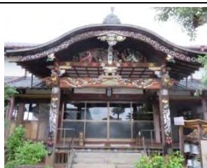
71 松寿山 桂秀院 曹洞宗 佐賀市久保田町久保田 779

国道 207 号線から牛津天満町県道 43 号線交差点で南 900m。芦刈小道より西 400m に案内板あり。千葉一族の徳島氏が鎌倉から江戸初期の居城跡の北側にある。参道通り門柱過ぎて、小さな六地藏が、本堂左に地藏堂がある。