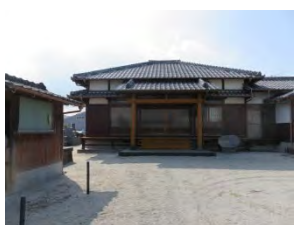
3 補陀山 普門寺 曹洞宗 佐賀市下田町 4-20

国道 207 号線「八戸」交差点過ぎ路地を北に長崎街道にある。山門を過ぎると両側には羅鑑像が並んでいる。本寺は鍋島藩の曹洞宗 12 か寺の一つの名刹で、葉隠れの語り手であった「山本常朝」と一族の墓がある。室町の豪族於保氏の居城跡で周囲は堀が囲っている