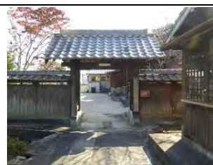
54 福聚山 海蔵寺 曹洞宗 佐賀市西与賀町今津110

城南中学校南西約500m、1431年で始まる案内板があるが、解説不能。本尊は行基作の「如意輪観音」という。戦乱で無住となっていたが1620年頃に開運和尚が現在地に移したとされる。