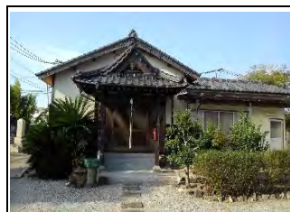
45 宝珠山 観音寺 曹洞宗 佐賀市本庄町本庄123

城南中学校南西約500m、1431年で始まる案内板があるが、解説不能。本尊は行基作の「如意輪観音」という。戦乱で無住となっていたが1620年頃に開運和尚が現在地に移したとされる。