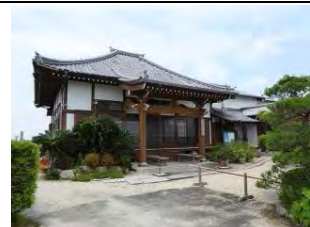
46 心月山 福林寺 曹洞宗 佐賀市本庄町鹿子46

市立野球場南東約500m、1598年龍泰寺三世により開山。以前は天台宗若しくは真言宗と言われる。寺院名は相応津の船着き場の宿泊所に由来。境内東側に弘法大師を祀る大師堂がある。