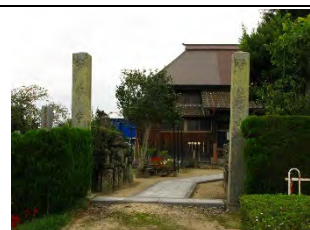
48 浄地山 安養寺 曹洞宗 佐賀市本庄町末次964