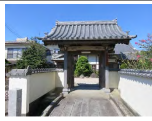
2 普門山 苗運寺 曹洞宗 佐賀市嘉瀬町扇町 2389

国道 207 号線「嘉瀬元町」交差点を南へ、有明沿岸道路入口手前より東へ入る。戦後の火災により資料は消失し寺歴は不明。創建当時から鍋島家ゆかりの寺で、寛永 9 年（1633）の創建。開基は鍋島直茂。開山は金峰鶴大和尚。弘法大師像は本堂の本尊横に祀ってある。