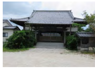
7 法雲山 栖龍院 臨済宗南禅寺派 佐賀市鍋島町蛸久 1259

国道 34 号線『嘉瀬大橋』300m 手前から北へ 400m 行くとある。本堂正面右側には 61 番札所が掲げている。境内には六地藏塔と石仏、石塔が並んでいる。寺の西側は嘉瀬川で周囲は大豆畑と水田が広がっている。