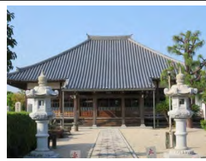
4 慶聚山 龍雲寺 曹洞宗 佐賀市八戸一丁目 6—35

国道 208 号線「八戸」交差点を北へ 300m 進み、西側住宅街を 300m 進む。元和元年（1615）開山。1917 年鉄肝和尚が老貧者を救う養老院を九州で初めて創設。本堂南側には鍋島光茂に保護寺昇格を直訴するも、叶わず斬首された「円蔵院」住職村了和尚の墓碑と石像がある。