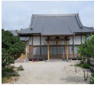
62 幻流山 富泉院 臨済宗南禅寺派 佐賀市嘉瀬町荻野 2477

国道 34 号線「森田」交差点を南へ流通センター交差点を西へ 1 km 進む。1515 年菅原道真の従弟の流れで、前山美濃守菅原利郷が創建。250 年前に描かれた大涅槃図があり、今でも色鮮やかな輝きを放つ。大般若經典が大村市で、戦国時代に作成された貴重な資料と判明。展示会も大村市で開催された。