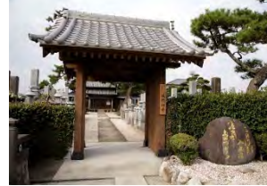
25 鹿祥山 威徳寺 臨濟宗南禅寺派 佐賀市川副町鹿江784

早津江病院南西約600m、 創建年代は不詳、固山一鞏和尚 による開山とされる。中興の梅 叔の代に鍋島家の命により薬師 如来を奉じて再建。寺宝として 大般若経600巻が伝わる。