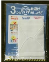
全戸配布予定の布マスク