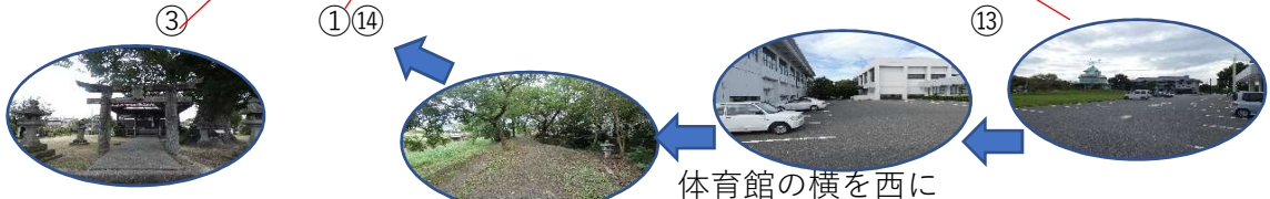
体育館の横を西に