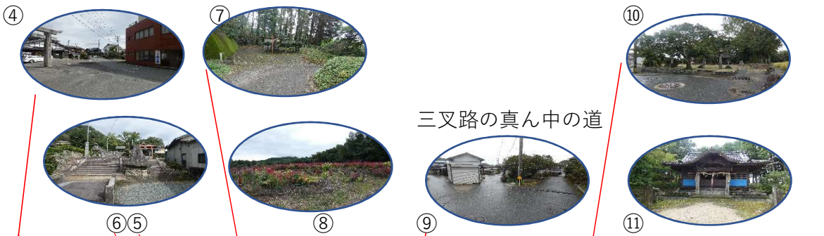
三叉路の真ん中の道