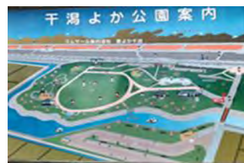
※干潟よか公園看板より

※東よか干潟は2015年(平成27年)5月に、国際的に重要な湿地としてラムサール条約に登録された