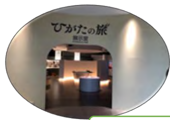
②ひがたの旅の展示場