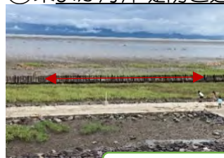
干潮時歩ける遊歩道