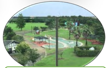
東は干潟よか公園