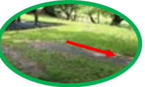
右へ降りる階段注意