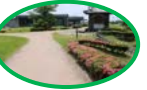
お堂手前右下へ降りる