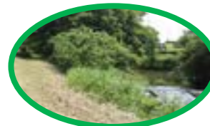
右に説明版・左階段上がる