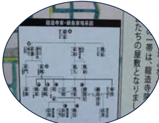
⑬龍造寺隆信と鍋島直茂は義兄弟